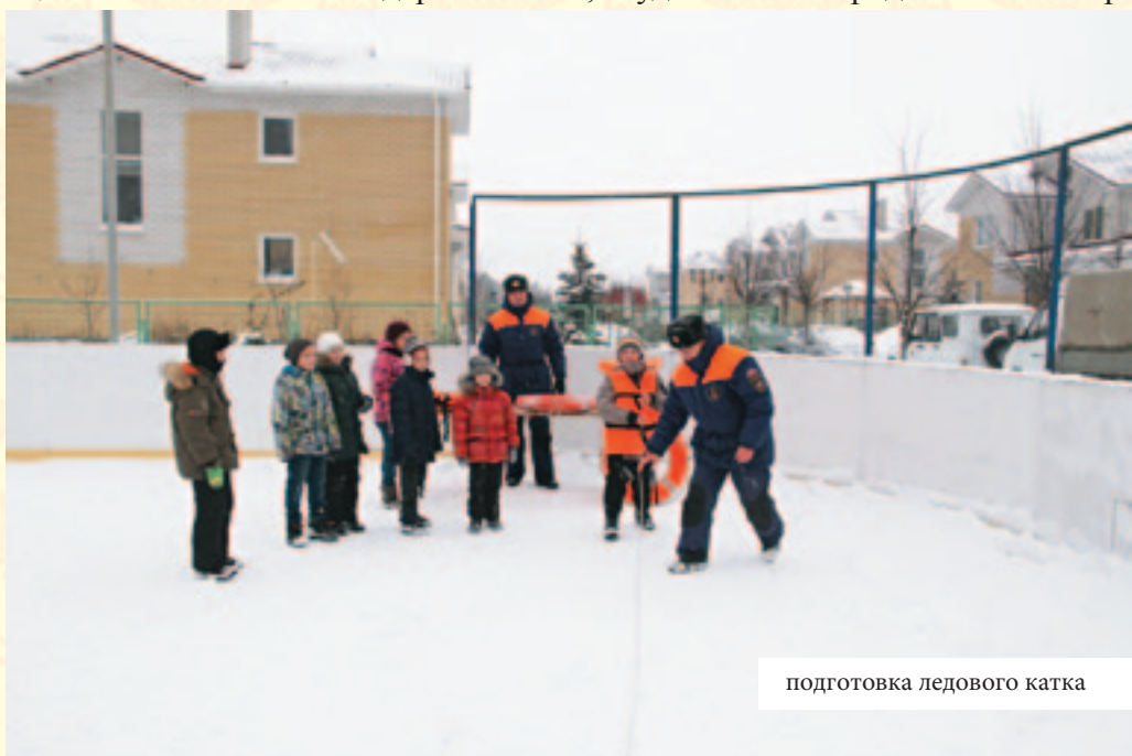
подготовка ледового катка

Те, кто знаком с нашим городком лишь понаслышке, часто задают вопрос: «на что это похоже?» В качестве объектов сравнения предлагают деревню SOS, студенческий городок или пионер-